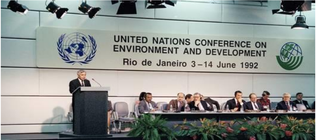
Şekil 2 Birleşmiş Milletler İklim Değişikliği Çerçeve Sözleşmesi, Rio de Janeiro, 1992.

1992 yılında Rio'da düzenlenen Birleşmiş Milletler (BM) konferansı iklim değişikliği konusunda küresel anlamda atılan ilk adımlardan biri olarak nitelendirilebilecek bir yapıya sahiptir. İlgili toplantıda bir araya gelen ülkeler yeni bir iklim rejiminin kurulmasına yönelik BM İklim Değişikliği Çerçeve Sözleşmesi'ni (BMİDÇS) imzalayarak sera gazı salımlarını 1990 seviyesinden aşağıya çekmeyi kabul etmiştir. Sözleşme Tarafların azaltım ve iklim değişikliğinin etkilerine uyuma ilişkin yükümlülüklerini tanımlarken gelişmiş ve gelişmekte olan ülkelere farklı yükümlülük koşulları tanımlamaktadır. 1995 yılından itibaren de ilgili çerçeve sözleşmeye taraf olan ülkeler Taraflar Konferansı'ndan her yılın Aralık ayında bir araya gelerek konuyla ilgili atılacak somut adımları ele almıştır.