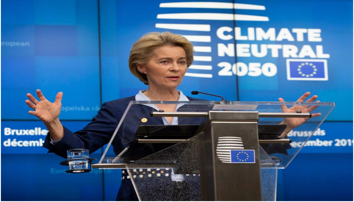
Şekil 3 Ursula Von Der Leyen Avrupa Yeşil Mutabakatı Tanıtım Toplantısı, 2019.

Bu kapsamda Avrupa Birliği yeni bir büyüme stratejisi çerçevesinde 2050 yılına kadar İklim-Nötr Kıta olma vizyonuyla kaynak etkin ve rekabetçi bir ekonomi olma yolunda yeni politika değişikliklerini uygulamaya başlamıştır.